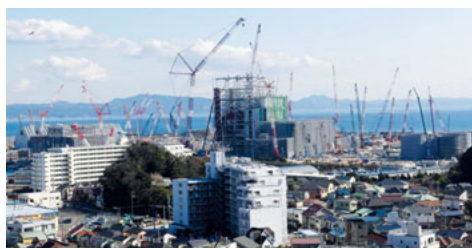
建設中の横須賀石炭火力発電所

そのほかにも、雇用調整助成金や休業支援金・給付金の周知と申請支援なども求めました。